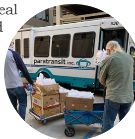
Volunteers accept lunches from Broderick Roadhouse Restaurant.

In 2020, even during the COVID-19 pandemic which limited volunteers, the group served more than 21,000 brown bag lunches to guests from Sacramento. Everyone who visits for a meal is considered a guest.